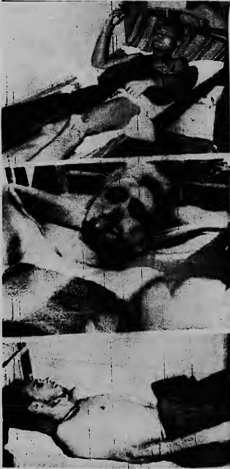
E tres hendenan aki ta tres preso mericano den prison Chi Hoa na Saigon quendenan a priminti di continua cu nan welga di hamber qu ta durando un luna caba, te dia nan muri of sali liber. Nan a cuminsa nan accion pa proba e supuesto practicanan corrupto di parti di un corte militar especial qu a ser nombra pa promer ministro Nguyen Cao Ky. E tribunal a condena nan a base di nan capacidad di paga pa sali liber, sino nan lo keda preso.